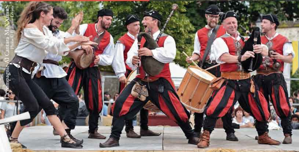
La compagnie Al Cantara MliXimms Alphonse - François Leysare