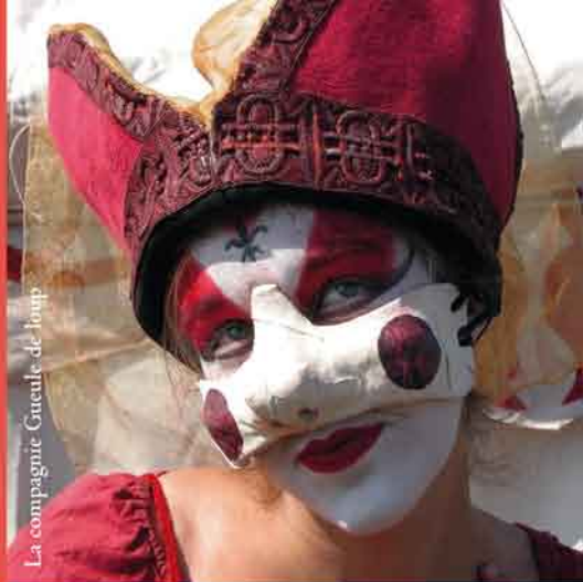
La compagnie Citeule de Loup

Tout le calendrier d'animations sur notre site internet : www.commanderie-arville.com ou par téléphone au 02 54 80 73 41.